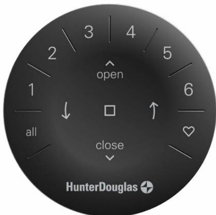
Gen 3 遙控器